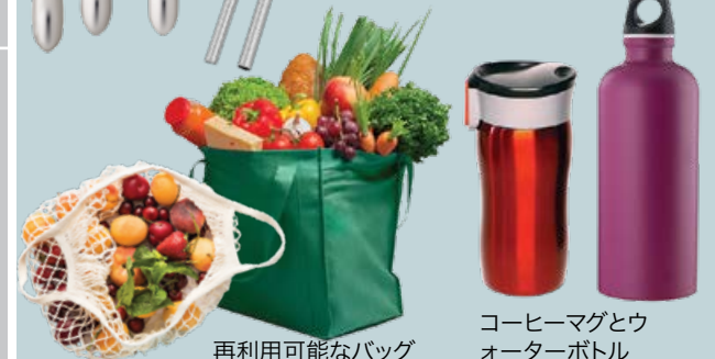
再利用可能なバッグ