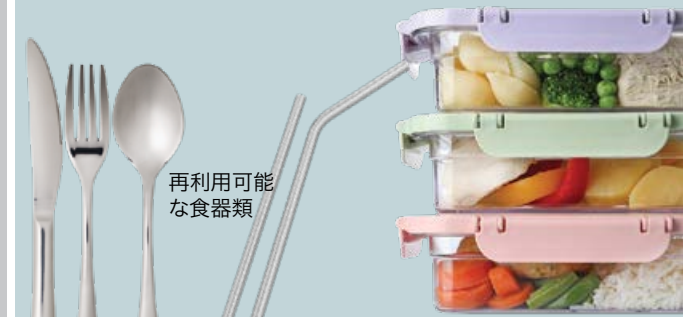
再利用可能な食器類