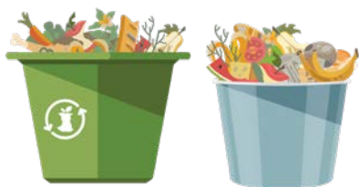
SPU የምግብ ቁርጥራጭ መያዣ አቅርቧል በቤት ውስጥ ምቹ የሆነ ማንኛውም መያዣ

1 የምግብ ፍርፋሪ ለመሰብሰብ ማንኛውንም እንደገና ጥቅም ላይ ሊውል የሚችል መያዣ ይጠቀሙ