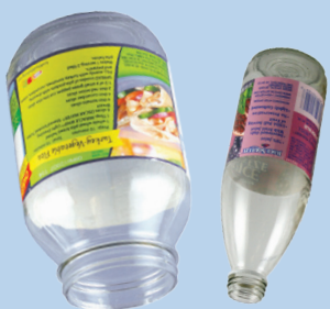
Бутылки и банки