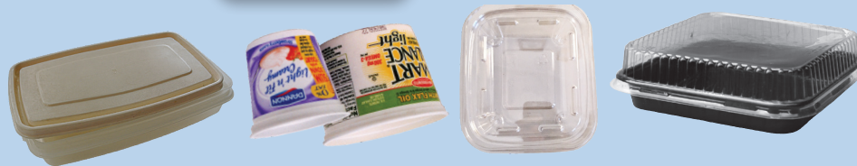
Чистые пластиковые и изготовленные из мелованной бумаги контейнеры от еды