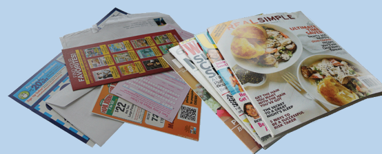
Почта, журналы, смешанная бумага

Пожалуйста, вымойте и поместите в перерабатываемые отходы!