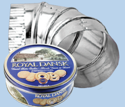
Металлолом (размеры меньше 2 x 2 x 2 фута)

ПРОДУКТЫ ПИТАНИЯ И ЖИДКОСТИ НЕ ДОПУСКАЮТСЯ