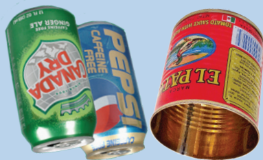
Алюминиевые и металлические банки