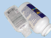
Баночки от таблеток (флаконы от отпускаемых по рецепту лекарств не допускаются)