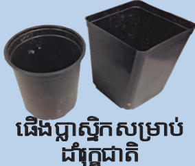
ធាតុប្លាស្ទិកសម្រាប់ដាំរុក្ខជាតិ