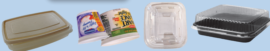
ប្រអប់ដាក់អាហារធ្វើពីប្លាស្ទិក និងធ្វើពីក្រដាសដែលមិនប្រឡាក់