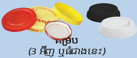
កម្រាល (3 អ៊ីញ ឬធំជាងនេះ)