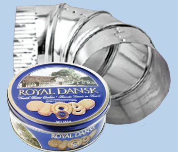
កម្រិតលោហៈ (ក្រោម 2 ហ្វីត x 2 ហ្វីត x 2 ហ្វីត)