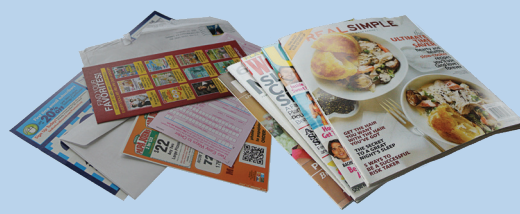
សំបុត្រ ទស្សនាវដ្តី ក្រដាសចម្រុះ