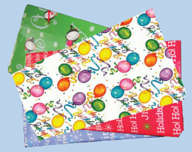
ក្រដាសខ្នុរ