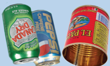
កំប៉ុងអាឡុយមីញ៉ូម/ដែក និងកំប៉ុងដែក