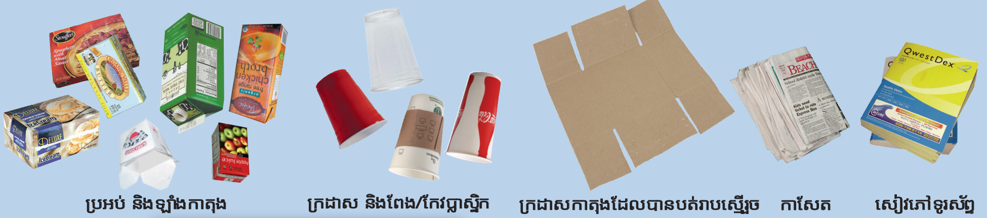
ប្រអប់ និងឡាំងកាតុង