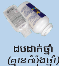
ដបដាក់ថ្នាំ (គ្មានកំប៉ុងថ្នាំ)