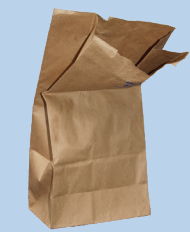
ថង់ក្រដាស