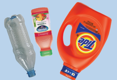
ដបប្លាស្ទិក (គ្រប់ពណ៌)