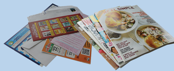
Surat, majalah, beragam jenis kertas