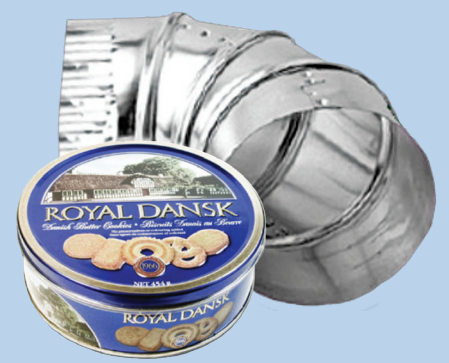
Serpihan logam (kurang dari 2 ft. x 2 ft. x 2 ft.)