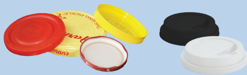
Tutup (3 inci atau lebih lebar)