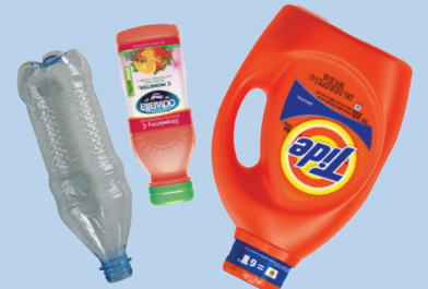
Botol plastik (semua warna)