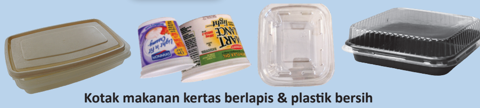
Kotak makanan kertas berlapis & plastik bersih