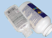
Botol obat (tidak boleh ada botol obat beresep)