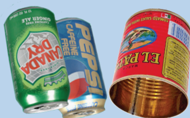
Kaleng aluminium & logam