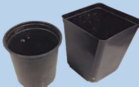
Pot tanaman dari plastik