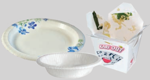
ብመግቢ ዝረሓሱ (መስመስ ዝብል) ናይ ወረቐት ሸሓነ፣ ኣሚቕ ሸሓነን መደርባይ ኣቕሑ