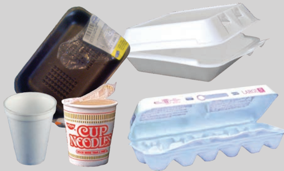
ናይ ፎም መትሓዝታት