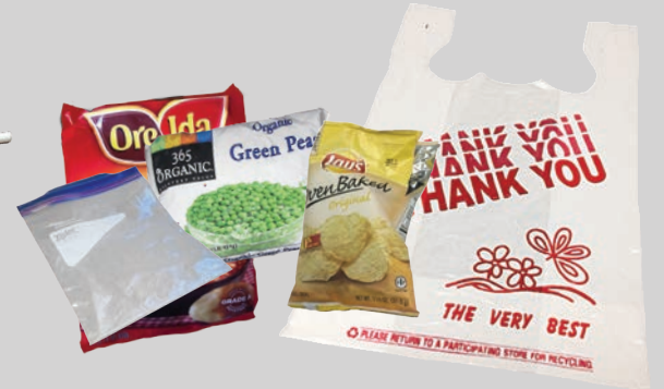
Ziploc®፣ ናይ መግቢን ብሕታዊ ክረጢታት ፕላስቲክ