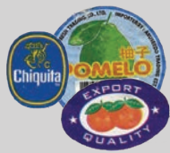
ናይ ፍሩታታት መጠቕላታት