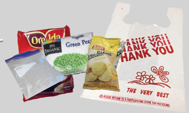
Ziploc®, mga supot ng pagkain, at mga supot na pang-isahang gamit