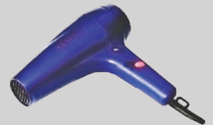
Maliliit na kagamitan sa bahay