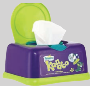
Mga produktong para sa pampersonal na kalinisan