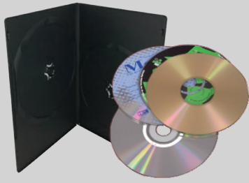
Mga CD, DVD at lagayan ng mga ito

Ilagay ang mga bagay na ito sa iyong basurahan.