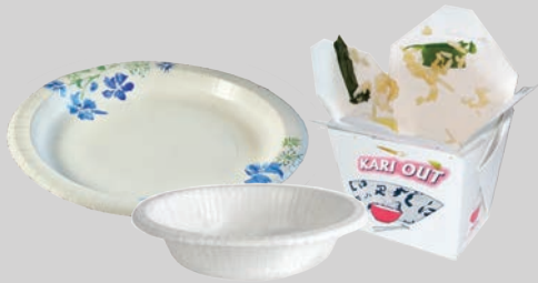
Mga coated (makintab) na papel na plato, mangkok at nailalabas na lalagyan na nilagyan ng pagkain