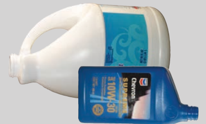
Mga walang lamang lalagyan ng mga nakakalasang bagay