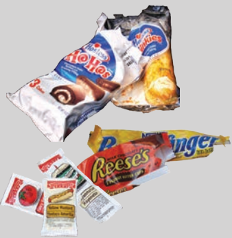
Mga pambalot ng pagkain