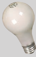
Mga non-fluorescent na bumbilya