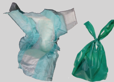
Mga diaper at dumi ng alagang hayop (nakasupot)