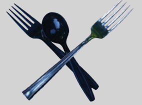
Mga pangkain na Kagamitan