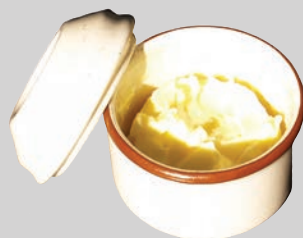
Mga taba, mantika at sebo mula sa kusina (sa isang saradong lalagyan)