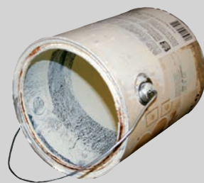
Mga lata ng pintura (walang takip, tuyo at walang laman)