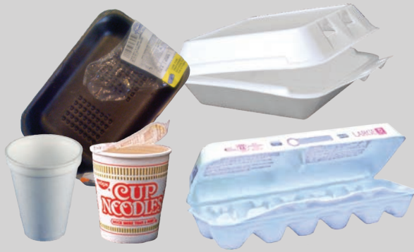
Mga foam na lalagyan