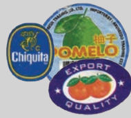
Mga sticker ng prutas