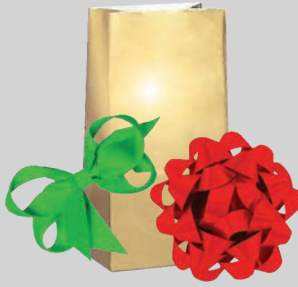
Mga laso at metallic na pambalot ng regalo