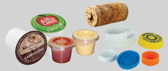
Maliliit na takip, tansan, pasak ng bote at tasa (wala pang 3 pulgada ang lapad)