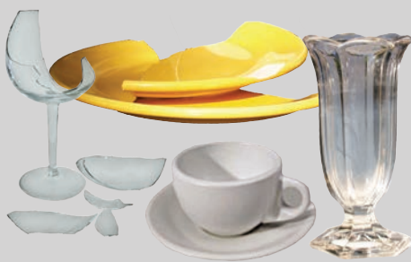
Mga ceramic at babasaging gamit (sira na o hindi na magagamit)