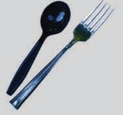
ເຄື່ອງໃຊ້ໃນເຮືອນ