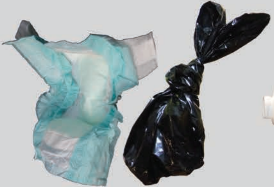
ຜ້າອ້ອມເດັກ ແລະ ຂອງເສຍຈາກສັດລ້ຽງ (ໃສ່ຖົງແລ້ວ)