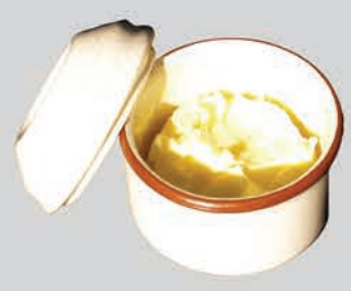
ໄຂມັນ, ນໍ້າມັນ ແລະ ໄຂມັນສັດ (ຢູ່ໃນພາຊະນະບັນຈຸທີ່ປອດໄຟ)