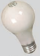
ຫຼອດໄຟທີ່ບໍ່ແມ່ນຫຼອດນິອອນ