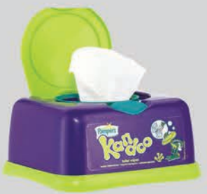
ຜະລິດຕະພັນທຳຄວາມສະອາດ