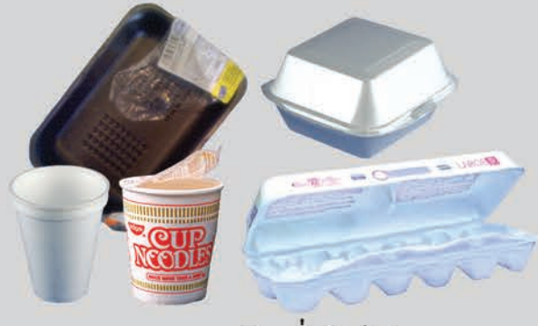
ພາຊະນະບັນຈຸທີ່ເປັນໄຟມ