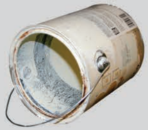
ກະບໍ່ອງສີ (ຝາເປີດອອກ, ແຫ້ງ ແລະ ເປົ່າ)