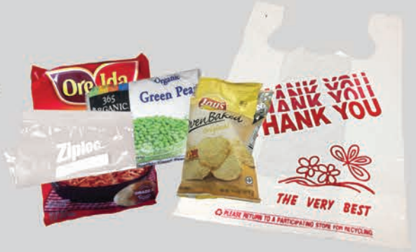
Ziploc®, ຖົງປລາສຕິກໃສ່ອາ ຫານ ແລະ ດຽວ