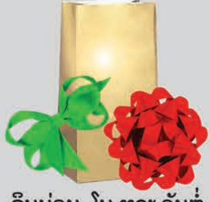
ຮິບບ່ອນ, ໂບ ແລະ ອັນຫໍ່ ຂອງຂວັນເປັນໄລຫະ