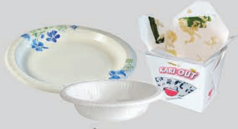
ຈານເຈ້ຍຫຸ້ມເປື້ອນ-ອາຫານ (ເຫຼື້ອມ), ຖ້ອຍ ແລະ ພາຊະນະເອົາກັບບ້ານ