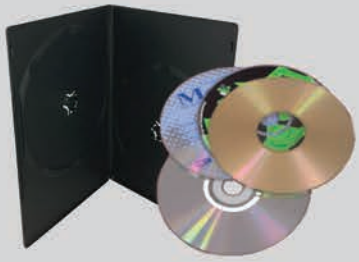
CD, DVD, ແລະ ຊອງ ໃສ່ຕ່າງໆ

ເອົາສິ່ງເຫຼົ່ານີ້ວົງໃສ່ໃນລໍ່ຂີ້ເຫຍື້ອຂອງທ່ານ.