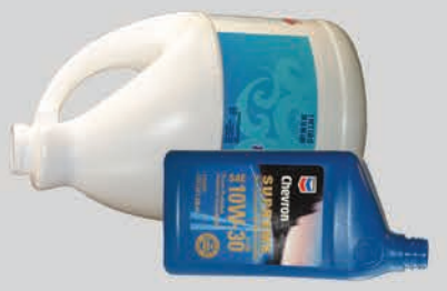
ພາຊະນະບັນຈຸວັດຖຸມີພິດເປົ່າ