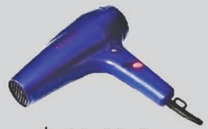
ເຄື່ອງໃຊ້ໄຟຟ້າໃນເຮືອນຂະ ໜາດນ້ອຍ