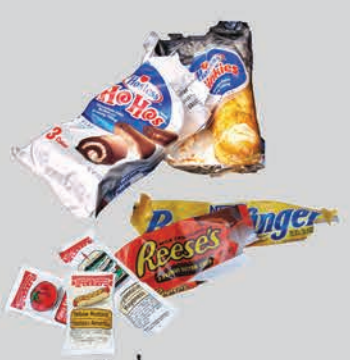
ອັນຫໍ່ອາຫານ