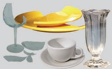
ເຊຣາມິກ ແລະ ເຄື່ອງແກ້ວ (ແຕກ ຫຼື ບໍ່ສາມາດໃຊ້ໄດ້)