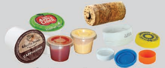
ຝາປິດນ້ອຍ, ຈຸກອັດ, ຝາປົກ ແລະ ຈອກ (ລວງກ້ວາງໜ້ອຍກວ່າ 3 ນິ້ວ)