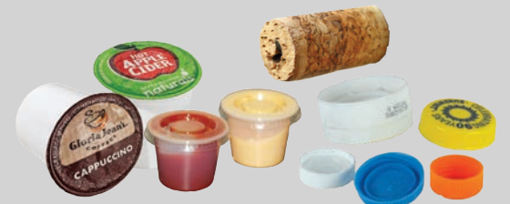
Tutup segel kemasan, tutup kap, tutup botol, & kap kecil (lebar kurang dari 3 inci)