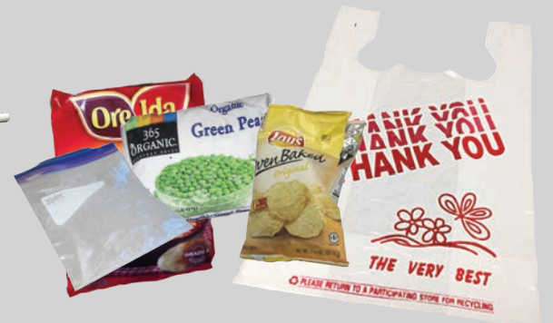
Ziploc®, kantong makanan & kantong plastik tunggal