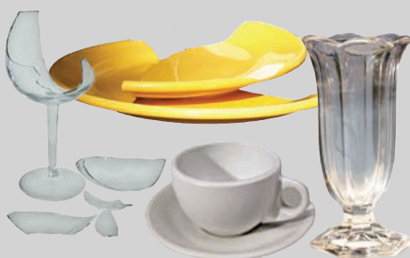
Barang-barang keramik & pecah belah (rusak atau sudah tidak dapat dipakai)