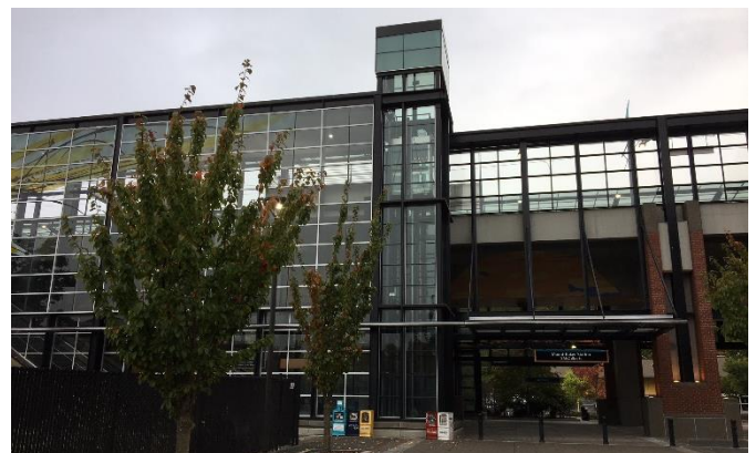
Nhà ga đường sắt nhẹ Mt Baker Light Rail

quan tập trung vào Lập kế hoạch Khu vực Ga Mt Baker để xác định các hành động khả thi và hữu hình điều phối các hoạt động đầu tư theo cách đáp ứng tốt nhất tầm nhìn của cộng đồng. Quy trình này đang được Văn phòng Lập kế hoạch và Phát triển Cộng đồng dẫn dắt.