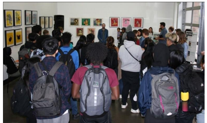
Sự kiện lấy ý kiến về Mt Baker Hub với học sinh trường trung học Franklin