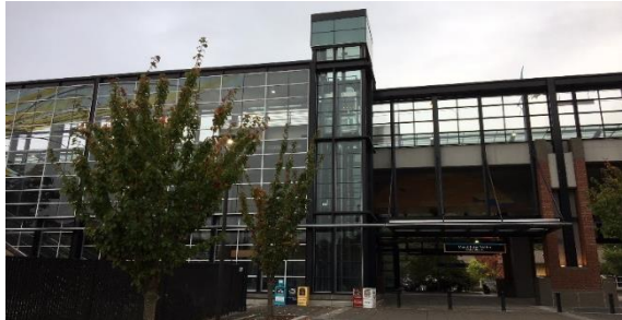
ស្ថានីយ៍រថភ្លើងធន់ស្រោល Mt Baker Light Rail

ហើយការរចនាចុងក្រោយ និងសំណង់បច្ចុប្បន្ន៖មិនទាន់មានថវិកានៅឡើយទេ។