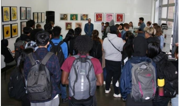
ព្រឹត្តិការណ៍នៃការចុះផ្សព្វផ្សាយជាមួយសិស្សវិទ្យាល័យ Franklin High School នៅ Mt Baker Hub (ស្ថាប័នរថភ្លើង Mt Baker Hub)

ធ្វើការស្ទង់មតិរបស់យើង! យើងចង់ស្តាប់ពីមនុស្សដែលរស់នៅ ធ្វើការ ដើរផ្សារ និងធ្វើដំណើរឆ្លងកាត់តំបន់នោះ។ ដាក់ចំណាត់ថ្នាក់ជម្រើសគម្រោងរបស់អ្នកនៅក្នុងការស្ទង់មតិតាមអនឡាញត្រឹមថ្ងៃទី11 ខែធ្នូ! www.surveymonkey.com/r/AMB_Survey