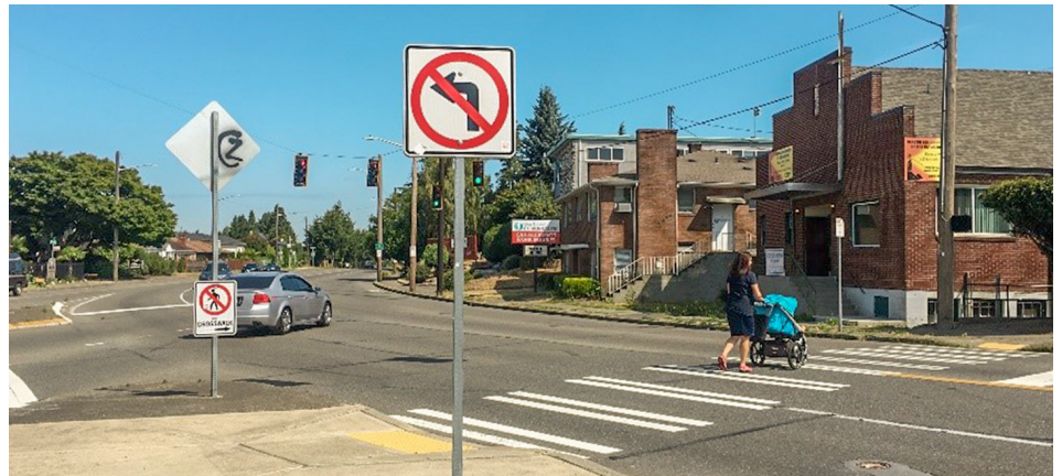
15th Ave S、S Columbian Way 和 S Oregon St 的交叉路口将进行安全改进。

位于 S Spokane St 与 S Angeline St 之间的 15th Ave S 为在 Beacon Hill 中出行的人士提供了重要的连接通道。西雅图交通部 (SDOT) 正对此通道进行改进,以平衡所有用户的需求,使每个人都能安全方便地到达他们需要前往的地方。