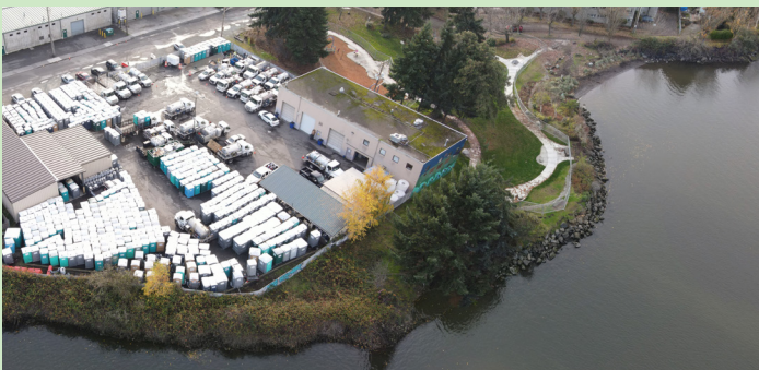
South Park - Hoàn thành quy trình lập kế hoạch địa điểm nhằm xác định các ưu tiên của cộng đồng cho địa điểm của Unity Electric.

Hai sự hợp tác sẽ thúc đẩy các dự án là các mô hình cho việc ra quyết định của cộng đồng, mối quan hệ đối tác, và kinh phí.