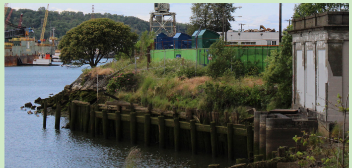
Georgetown - Cải thiện khả năng tiếp cận trên đường 8th Ave.