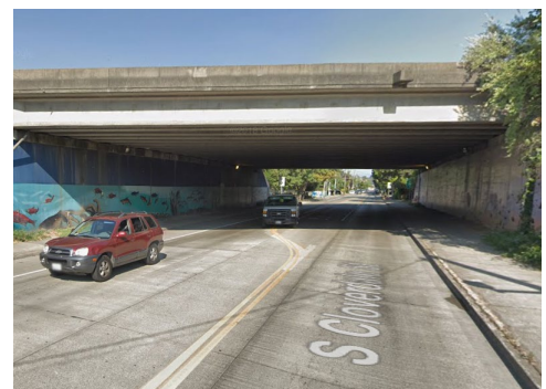
Las cuadrillas reemplazarán las luces debajo del paso elevado de la State Route 99 en South Cloverdale Street.